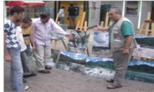
Beşim boyamak için boyaları

Bayburt Bilim Eğitim ve Kültür Derneği (Bekder), Bayburt, İspir, Yusufeli ve Artvin'de açtığı Fotoğraf Sergileriyle Çoruh Nehri'nin Temiz Tutulmasını İstedi.